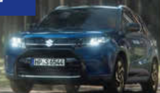
Abbildung zeigt aufpreispflichtige Sonderausstattung. Mehr Informationen zu Ausstattungslinie und Sonderausstattungen finden Sie hier: