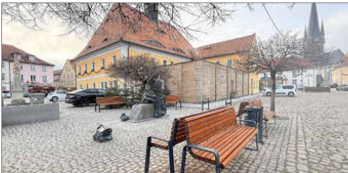
Neue Bänke im Bereich der Brunnenanlage auf dem Markt

Damit konnte der Marktbereich attraktiver gestaltet werden und lädt ab der wärmeren Jahreszeit zum Verweilen ein.